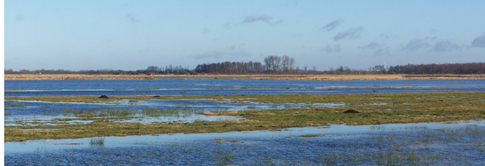
Vernässungspolder im Ochsenmoor